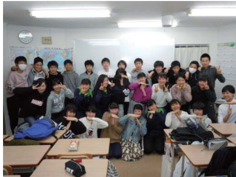
(写真は菊水教室の卒業メンバーです)